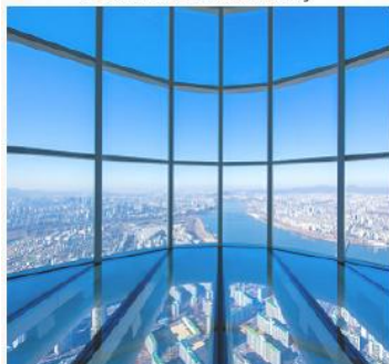
Observatorio Seoul Sky