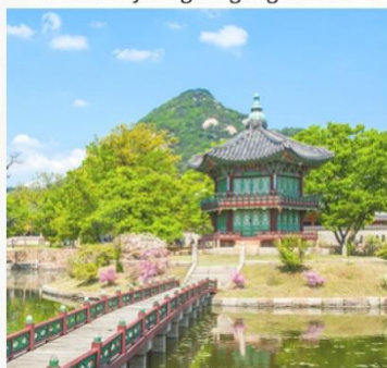
Palacio Gyeongbokgung en Seúl