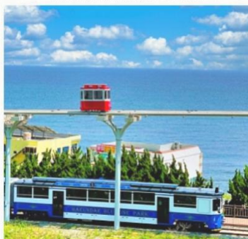
Blue Line Park en Busan